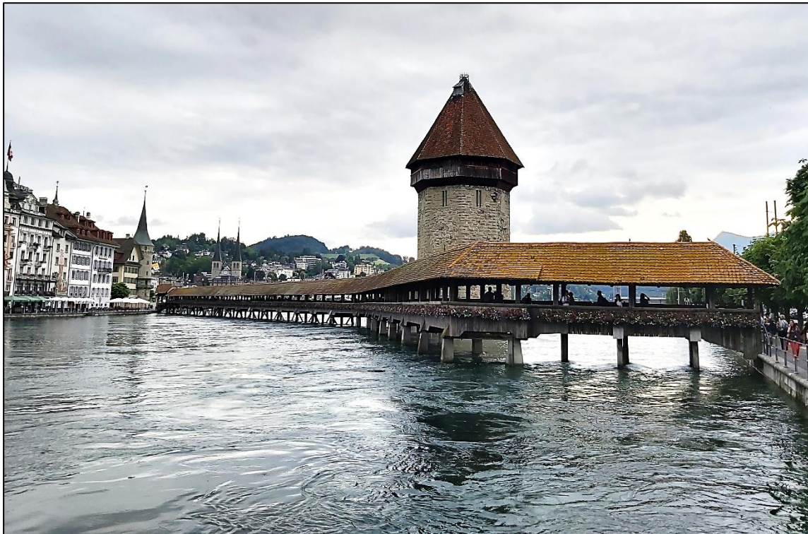
Obr. 4 Kaplnkový most v Luzerne“

Švajčiarsko má jeden národný park – Swiss National Park (170,3 km 2 ), v ktorom sú územia s najprísnejšou ochranou prírody. V ďalších 19 prírodných parkoch sa miestni obyvatelia venujú udržateľnej regionálnej ekonomike, cestovnému ruchu, regionálnym gastronomickým špecialitám, živým tradíciám a starajú sa o svoj región, mestá, dediny, o kultúrne a prírodné bohatstvo, o prostredie v ktorom žijú, bývajú a pracujú.