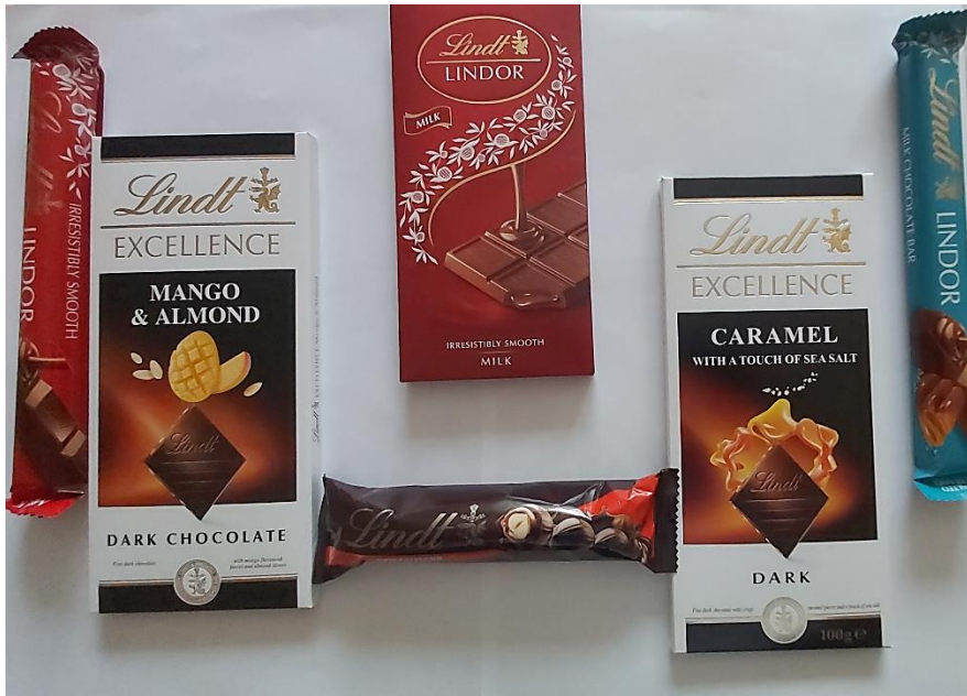
Obr. 1 Chutné suveníry zo Švajčiarska“

hodiniek, šperkov, meracích a optických prístrojov, počítačových prístrojov, IT zariadení, elektroniky, špičkových liekov a kozmetiky – sú stelesnením Švajčiarska.